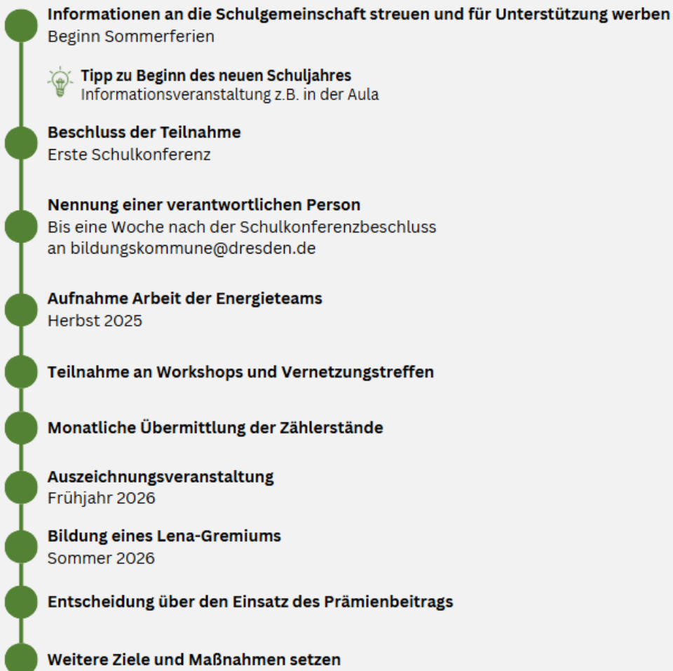
Abb. 4: Meilensteine der Energieteams, eigene Darstellung