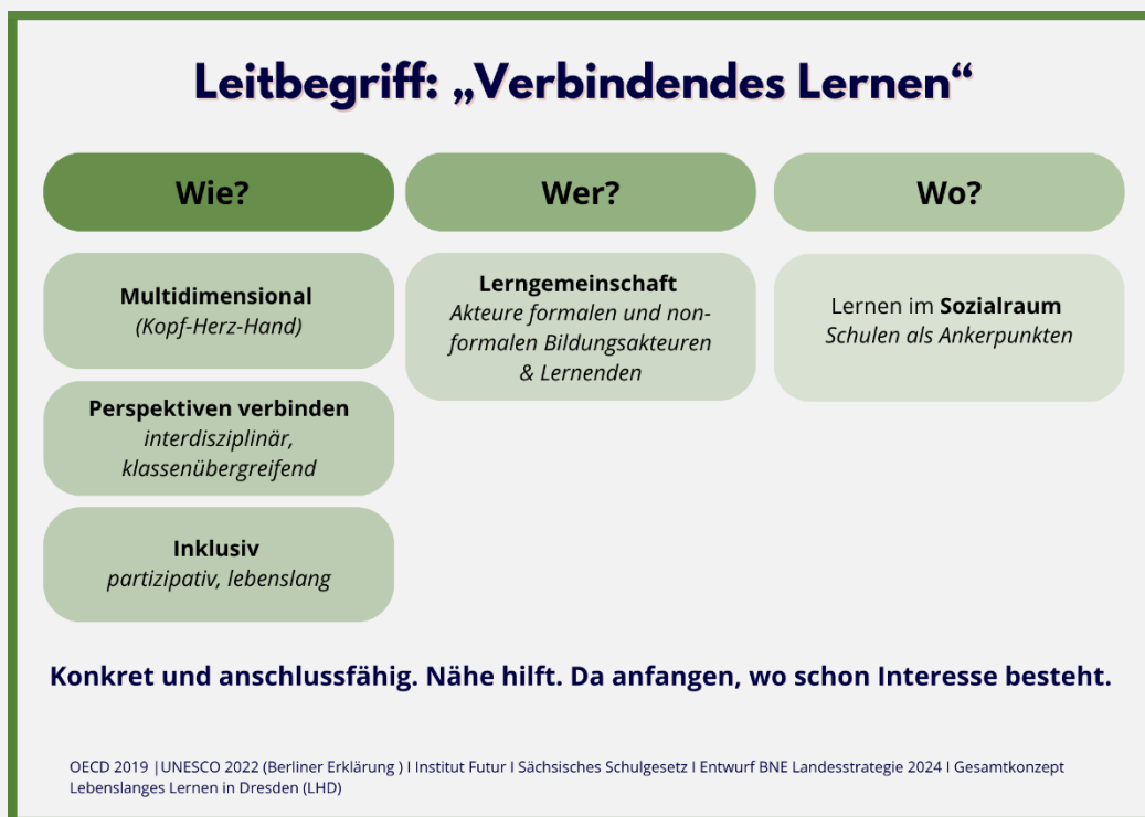
Abb. 1: Leitbegriff: „Verbindendes Lernen“