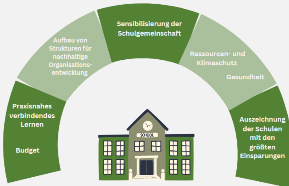
Abb. 3: Vorteile für Ihre Schule durch die Einrichtung von Energieteams, eigene Darstellung

Die Gründung eines Energieteams hat vielfältige Vorteile. Energieteams tragen zum Etablieren des Ansatzes Verbindendes Lernen an Schule bei. Lerninhalte aus dem Unterricht können mit praktischem Handeln und der eigenen Lebenswelt verknüpft werden. Es trägt zugleich dem Whole Institution Ansatz Rechnung, indem ein partizipativer Ansatz gewählt wird, der die gesamte Schulgemeinschaft einbezieht und die Übernahme von Verantwortung fördert. Ein nachhaltiger Betrieb der Schule, die Kommunikation zum Thema Nachhaltigkeit und zentrale Themen aus dem Unterricht gehen dabei Hand in Hand. Neben einem wichtigen Beitrag zum Ressourcen- und Klimaschutz, trägt richtiges Lüften und Heizen zugleich zum Gesundheitsschutz bei, indem ein gutes Raumklima gefördert wird. Nicht zuletzt sollen die Einsparungen aber auch den Schulen selbst zugutekommen und anteilig an das Projekt DD-Lena und ins Schulbudget zurückfließen.